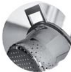
אביזר נלווה - מסננת/כלי לאידוי המתאים לסיר