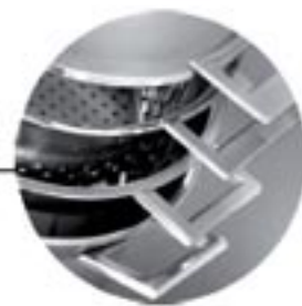
הכלים נכנסים אחד בשני נוח לאחסון